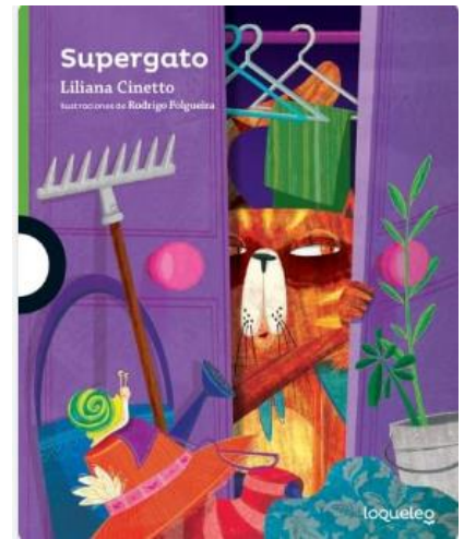
Supergato – Liliana Cinetto Santillana

Literatura de verano: Se comenzará a trabajar su contenido en marzo, es importante que se lea este material durante el verano.