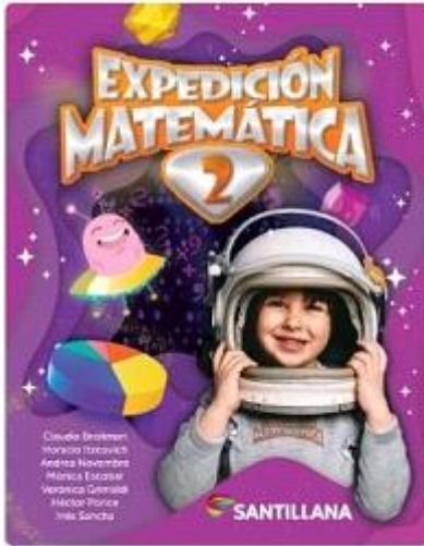
Expedición Matemática 2 Santillana