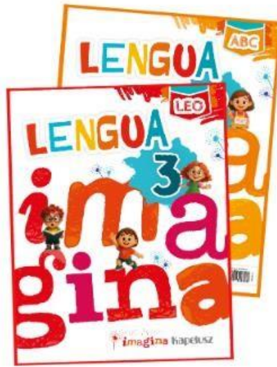
Lengua imagina 3 – Kapelúsz