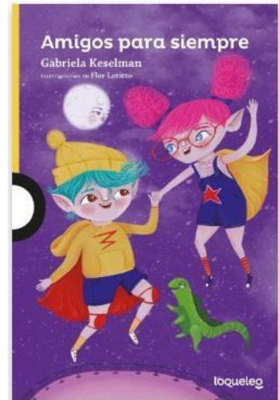
Amigos para siempre Gabriela Keselman

Literatura de verano: Se comenzará a trabajar su contenido en marzo, es importante que se lea este material durante el verano.